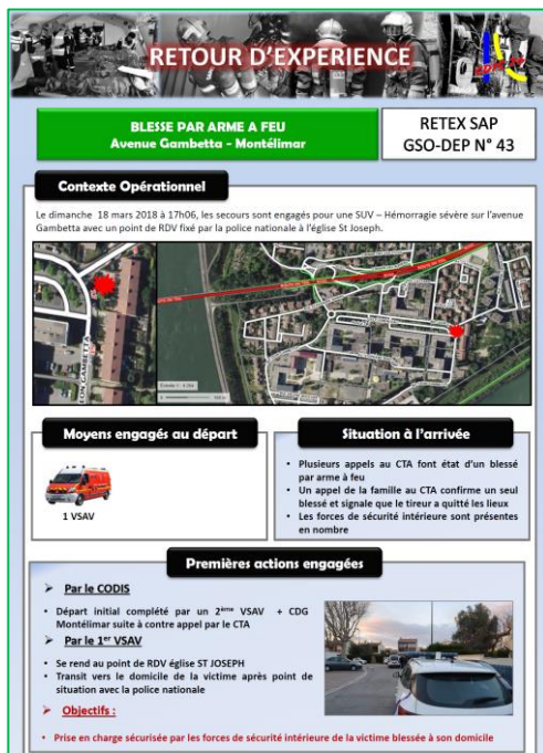
Blessé par arme à feu SDIS 26